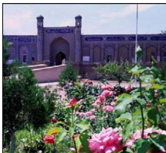
Дворец кокандского хана Худояра в наши дни

кенте, Чимкенте, Аулие-Ата (в советское время город Джамбул, ныне город Тараз в Казахстане), в укреплении Джулек и Форт-Перовском (в советское время город Кзыл-Орда, ныне Кызылорда в Казахстане). Командир и штаб полка разместились в Ташкенте при штаб-квартире Туркестанского военного округа.